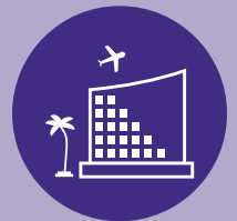
Hostelería y Turismo