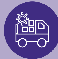
Transporte y Logística

ELEGIBILIDAD PARA EL PROGRAMA: SECTOR es un programa de la Oficina de Desviación y Reintegración del Departamento de Salud del condado de Los Ángeles y es financiado por el Consejo de California de Correcciones del Estado y de Comunidades gracias a la Proposición 47. Los participantes elegibles son adultos mayores de 18 años que hayan sido arrestados, acusados o condenados por un delito penal menos grave y tengan necesidades de salud mental o trastornos por uso de sustancias. Para más información contacte a Joseph Wise-Wiley at jwise-wiley@jcod.lacounty.gov .