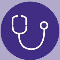
Salud y Asistencia Social

Asistencia para conseguir trabajo después de finalizar el programa